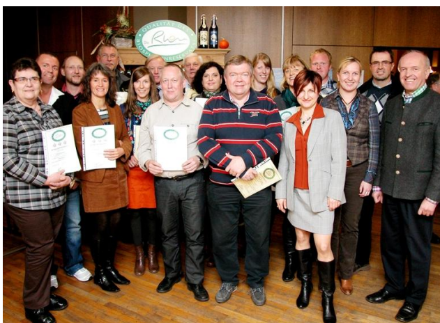
Die Dachmarke Rhön zeichnete anlässlich ihrer Mitgliederversammlung wieder eine Vielzahl von Unternehmen mit dem Qualitätssiegel Rhön, Biosiegel Rhön oder Silberdisteln aus.