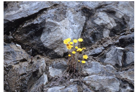
Foto: Basalt in der Rhön