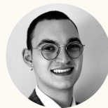
Jan Expansion Associate