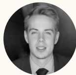
Till Expansion Manager