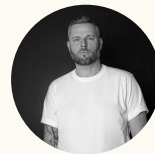
Matti Operations Lead